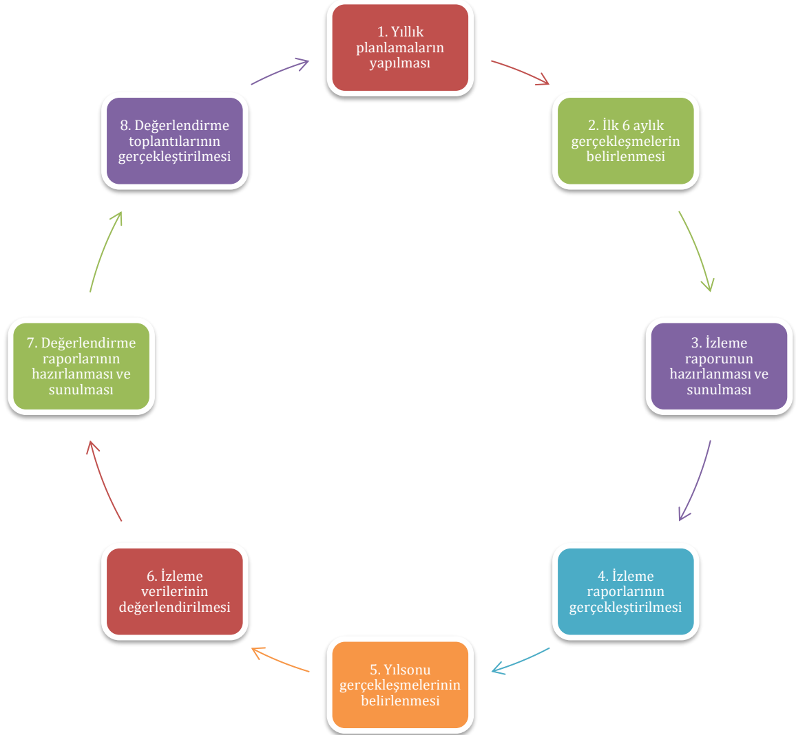
Tablo 33: İzleme ve Değerlendirme Süreci Tablosu

İzleme ve değerlendirme sürecinin işleyişi ana hatları ile aşağıdaki şekilde özetlenmiştir. Okulumuz 2024–2028 Stratejik Planı'nda yer alan performans göstergelerinin gerçekleşme durumlarının tespiti yılda iki kez yapılacaktır. Ara izleme olarak nitelendirilebilecek yılın ilk altı aylık dönemini kapsayan birinci izleme kapsamında, performans göstergeleri ve stratejiler ile ilgili gerçekleşme durumlarına ilişkin veriler toplanarak konsolide edilecektir. Performans hedeflerinin gerçekleşme durumları hakkında hazırlanan “Stratejik Plan İzleme Raporu” kurum amirlerinin bilgisine sunulacaktır. Bu aşamada amaç, varsa öncelikle yıllık hedefler olmak üzere, hedeflere ulaşılmasının önündeki engelleri ve riskleri belirlemek ve yıllık hedeflere ulaşılmasını sağlamak üzere gerekli görülebilecek tedbirlerin alınmasıdır. Yılın tamamına ilişkin ikinci izleme kapsamında ise ilgili birimlerden sorumlu oldukları performans göstergeleri ve stratejiler ile ilgili yıl sonu gerçekleşme durumlarına ait veriler toplanarak konsolide edilecektir.